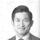
大学生は近い未来のお得意様だ

やないかな。やはりJ1は1ステージ制でないといやJ2はプレーオフがあるから面白い……。そんな議論が出るのが大事。そこからベストの道が探られ、